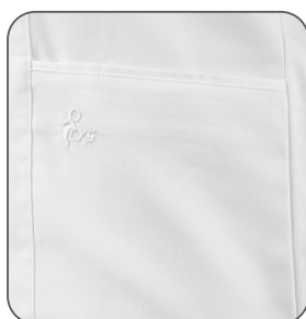
detail na spodní kapsu detail na spodné vrecko detail on the lower pocket detail na dolną kieszeń