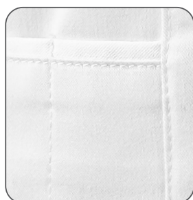
detail kapsičky na tužku detail vrecka na ceruzky detail of the pencil pocket detail kieszonki na ołówek